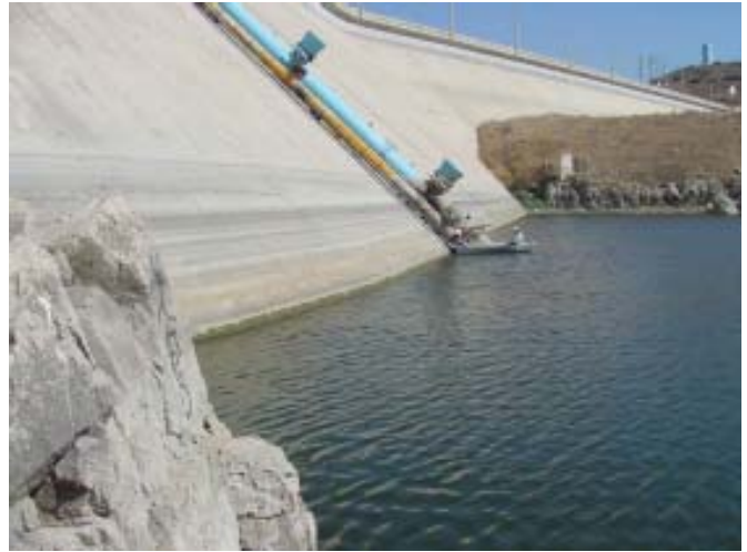
Instalación de un sistema de telemetría en la Presa Abelardo L. Rodríguez

Asimismo, la CILA llevó a cabo la instalación de un nuevo sistema de telemetría en la estación de la Presa Abelardo L. Rodríguez. El propósito del sistema de monitoreo remoto es conocer en tiempo real la capacidad de la Presa Abelardo L. Rodríguez. Esta presa está localizada a 17.7 kilómetros (11 millas) al sur de la frontera internacional, cuando ésta se desborda, el agua corre al norte hacia los Estados Unidos y viaja a través del Valle del Río Tijuana hacia el Océano Pacífico. La distancia de 17.7 kilómetros proporciona poco de tiempo para alertar o iniciar acciones para minimizar los daños debido a las avenidas. El sistema proporciona información en tiempo real de precipitaciones y los niveles de la presa a la Comisión Nacional del Agua de México, dependencia responsable de la operación de la presa Rodríguez. Asimismo, la información es transferida a un transmisor Hydrolynx y enviada a otras dependencias involucradas, incluyendo a la Sección estadounidense de la CILA.