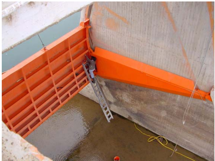
Mantenimiento de la Presa Morelos

Asimismo, la Comisión monitoreó la calidad de las aguas entregadas a México y mantuvo las estaciones hidrométricas del Río Colorado.