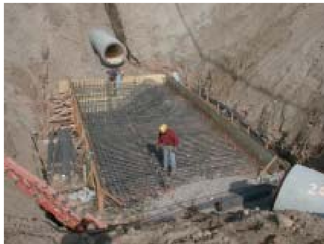
Construcción de la conexión para el retorno del efluente

Se ha obtenido un progreso significativo en el mejoramiento de la coordinación operativa entre ambos países. Se ha establecido un protocolo de comunicación entre los operadores de sistemas de aguas residuales en ambos lados de la frontera, facilitando así la notificación a tiempo en caso de situaciones de emergencias o problemas, tales como fallas en el equipo, las cuales requieren de coordinación binacional.