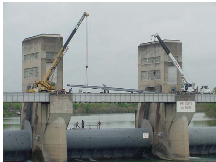
La Presa Anzaldúas

Al igual que la presa Retamal, la presa Anzaldúas es una estructura derivadora localizada en el Valle del Bajo Río Bravo. La Presa Anzaldúas deriva hacia los Estados Unidos la parte correspondiente de las aguas del Río Bravo a su cauce de alivio y además al canal del sistema mexicano de riego.