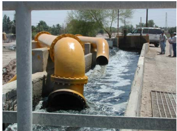
Influente en las lagunas de Mexicali

Considerando que existe la problemática de las descargas directas de aguas residuales se estableció un programa de monitoreo de aguas residuales y pretratamiento industrial, el cual fue propuesto originalmente por parte de la Agencia de Protección Ambiental del Estado de California (Cal-EPA) en el 2002. El programa consiste en brindar asistencia técnica y capacitar al personal de la Comisión Estatal de Servicios Públicos de Tijuana (CESPT) y de Mexicali (CESPM) a fin de establecer criterios básicos referentes a las descargas de aguas residuales a los sistemas.