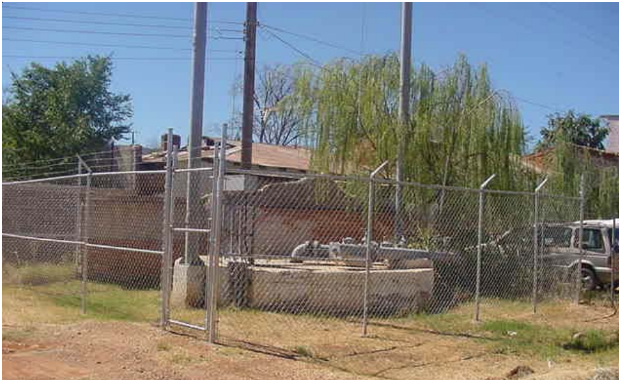
Infraestructura de saneamiento en Naco, Sonora

La CILA realizó cuatro inspecciones conjuntas a los sistemas lagunares para el tratamiento de aguas residuales en Naco, Sonora, conocidos como Sistema Lagunar Oeste y Sistema Lagunar Este, con el propósito de observar las condiciones de operación actuales. El Comité Coordinador que cuenta con representantes de la