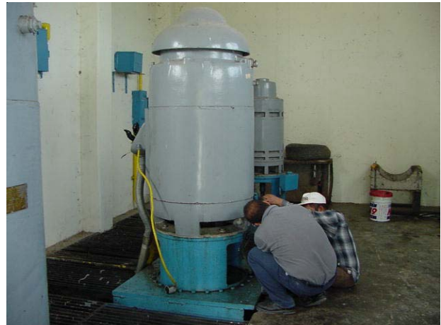
Bomba del Dren El Morillo

El Dren Morillo, localizado en el estado de Tamaulipas, México, es un proyecto binacional que conduce aguas salinas de retorno de riego al Golfo de México, reduciendo así la salinidad del Río Bravo. Conforme a los acuerdos de las Actas 223 y 303 de la Comisión Internacional de Límites y Aguas, se realizaron trabajos de mantenimiento del Dren, la estación de bombeo y del vertedor que controla el flujo de agua hacia el Río Bravo, consistentes en desmontes, deshierbes, desazolve y reposición de losas en algunos tramos del canal, así como el mantenimiento en general del edificio de la estación de bombeo, de las bombas, panel de control y la subestación eléctrica, entre otros trabajos. Los fondos necesarios para este proyecto fueron compartidos entre México, los Estados Unidos y agricultores de Texas.