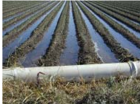
Obras de conservación en los distritos de riego en el Río Conchos

El acuerdo establece que la CILA lleve a cabo inspecciones de campo para observar la construcción y el progreso de las obras. La primera inspección por la CILA se realizó en diciembre de 2003. Ingenieros de la CILA visitaron 3 distritos de riego en Chihuahua, el Distrito de Riego Delicias (005), el Distrito de Riego del Río Florido (103), y el Distrito del Bajo Río Conchos (090). Las mejoras planeadas son: revestimiento de los canales, instalación de sistemas de irrigación de baja presión mediante la aplicación de agua con tubos multicompuerta, nivelación de terrenos, instalación de sistemas de alta presión para riego de goteo y aspersión, y rehabilitación de cárcamos. Se espera que la finalización de estas obras y el logro de los volúmenes de agua ahorrados demoren cuatro años. Durante la visita de los ingenieros, los contratos con fondos internacionales habían sido apenas otorgados y el progreso de la construcción era mínimo. Sin embargo, los proyectos realizados con fondos de México estaban ya en construcción.