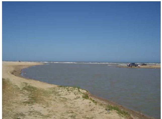
Desembocadura del Río Bravo

La CILA actuó durante el año 2003 en relación a las preocupaciones sobre la desembocadura del Río Bravo. En virtud de que el cauce del río en su descarga al Golfo de México se obstruyó con una barra de arena durante parte de los años 2001 y 2002, se realizaron varias inspecciones entre organismos federales y ambas Secciones de la CILA, y se exploraron alternativas a través de los cuales la desembocadura del Río Bravo al mar se conservaría mediante la