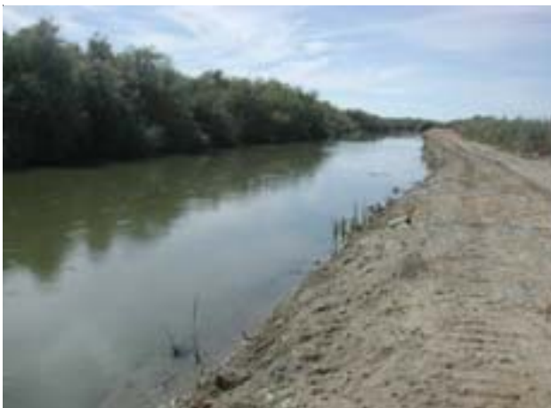
Dren de Desvío Wellton-Mohawk

Con base en recorridos de campo conjuntos, la CILA y la Comisión Nacional del Agua identificaron los trabajos de mantenimiento requeridos para este año, se formuló, acordó y llevó a cabo el programa de mantenimiento del Dren Wellton-Mohawk, a fin de asegurar la conducción y derivación hacia la Ciénega de Santa Clara, de las aguas salobres provenientes del drenaje agrícola del Valle de Yuma. Durante la ejecución de los trabajos se realizaron recorridos para la supervisión de los mismos, que consistieron en remoción de la vegetación y maleza en las bermas, limpieza de la plantilla y taludes del canal. Así mismo se reemplazaron las compuertas del Dren y se rehabilitaron los mecanismos de las mismas.