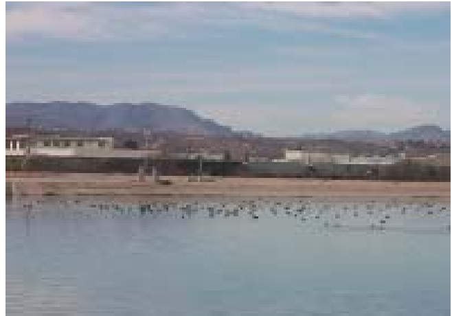
Planta Internacional de Tratamiento de Aguas Residuales de Nogales

La Planta Internacional de Tratamiento de Aguas Residuales de Nogales (PITARN) ubicada en Río Rico, Arizona, trata aguas residuales de las ciudades de Nogales, Sonora-Nogales, Arizona. La planta pertenece a la Sección estadounidense de la CILA y a la ciudad de Nogales, Arizona. La Sección estadounidense de la CILA opera la planta y recibe reembolso por parte de México de los costos correspondientes a las aguas residuales tratadas que se generan en Nogales, Sonora y de la ciudad de Nogales, Arizona por el tratamiento de drenaje.