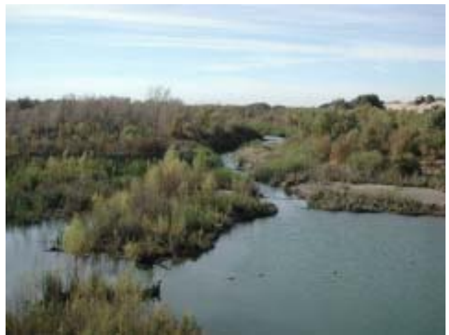
Río Colorado aguas abajo de la Presa Morelos

La Sección estadounidense de la CILA continuó trabajando en la preparación de la Declaración de Impacto Ambiental del Proyecto de Preservación del Límite y Capacidad de Conducción. El propósito de este proyecto es preservar el límite internacional donde éste es formado por el Río Colorado, así como mejorar la capacidad de conducción de flujos de avenidas de manera segura. Las alternativas del proyecto consideran diferentes alineaciones del río, dragado y modificación de los bordos de control de avenidas. La Sección estadounidense de la CILA llevó a cabo diversas reuniones con los involucrados durante el año, a fin de informar a las partes interesadas acerca del proyecto y obtener comentarios de su parte. Adicionalmente, ambas Secciones de la CILA continuaron su coordinación referente a este proyecto.