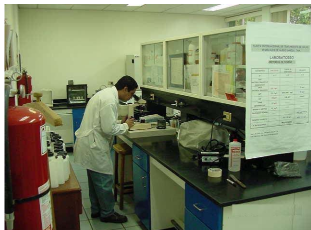
Monitoreo de calidad del agua

La Comisión finalizó y publicó el “Estudio Binacional sobre el Monitoreo Intensivo de la Calidad de las Aguas del Río Bravo en el tramo de Nuevo Laredo, Tamaulipas y Laredo, Texas entre México y Estados Unidos del 6 al 16 de noviembre de 2000”, cuyos objetivos fueron: 1) hacer un análisis comparativo de las condiciones de la calidad de las aguas del Río Bravo, 2) mejorar los programas permanentes de calidad del agua y 3) medir los efectos benéficos de la calidad del