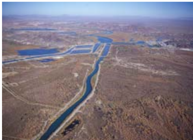
Vista del Canal Todo Americano

México a través de la CILA ha presentado su postura en el sentido que el proyecto impactará a México, afectando áreas de riego que dependen directa o indirectamente de las aguas que infiltran del CTA y provocará el abatimiento de aguas subterráneas o el incremento de salinidad de las aguas subterráneas.