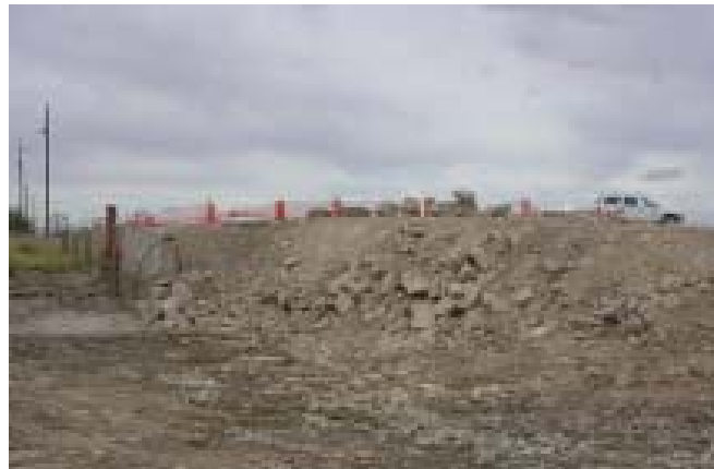
Trabajos en la Presa Riverside

La Presa Riverside, que fue construida en los 1920's en Cd. Juárez, Chihuahua – El Paso, Texas, sirvió como presa derivadora y estructura de control de pendiente durante seis décadas hasta que dicha presa falló en la avenida de 1987. Por lo anterior, fue erigida de manera temporal una protección con roca con el fin de que el agua continuara siendo derivada en el canal adyacente de los Estados Unidos. A lo largo de los años, los sedimentos acumulados en el cauce principal a la parte alta de la protección con roca implicaron un riesgo en la seguridad en caso de una avenida. Las partes afectadas en México y los Estados Unidos estuvieron de acuerdo en que la vieja presa y la protección de roca estaban obstruyendo los flujos del Río Bravo. En el 2003, el Buró de Reclamación de los Estados Unidos removió porciones de la Presa Riverside y la protección de roca, permitiendo que se procediera con planes de remover los azolves acumulados y reemplazar la estructura permanentemente.