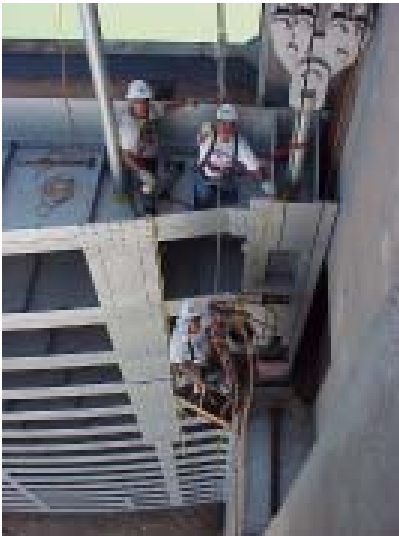
La Presa Falcón

al año 2002, cuando a finales de ese año la presa tenía un 27% de su capacidad útil. Se mantuvo el programa normal de monitoreo y mantenimiento de los elementos estructurales y mecánicos de la presa, así como con las actividades de operación propias de la misma para extraer los volúmenes de agua demandados por cada país.