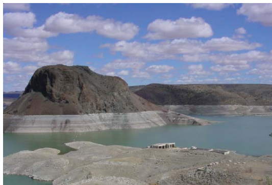
La Presa Elefante en Nuevo Mexico

En virtud de los bajos almacenamientos de las presas Elefante y Caballo, se realizaron diversas reuniones binacionales con la participación de autoridades de ambas Secciones de la CILA, la Comisión Nacional del Agua (CNA) y el Buró de Reclamación de los Estados Unidos (USBR), sobre la disponibilidad de agua, pronósticos de escurrimiento y la reducción proporcional en la entrega de agua a los usuarios de México y Estados Unidos en el 2003.