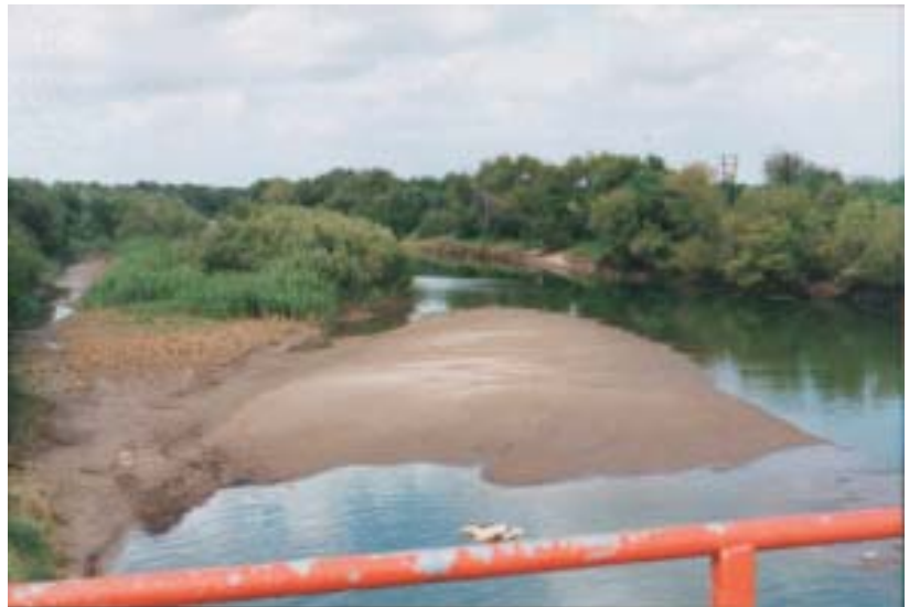
Azolve en la Presa Retamal

La Sección estadounidense inició un estudio ambiental del plan de remover el azolve aguas abajo de la Presa Retamal, una presa derivadora de la Comisión diseñada para controlar las avenidas en el área de Matamoros, Tamaulipas-Brownsville, Texas, así como para permitir a México derivar sus aguas correspondientes del Río Bravo al cauce de alivio mexicano. Dado que la presa fue construida en la década de 1970, el azolve se ha venido acumulando en el cauce del lado estadounidense del río. Debido a que la dinámica del río causa un acumulamiento de azolve en la porción izquierda del cauce debajo de la Presa Retamal, se formó una isla y un acumulamiento de arena aguas abajo de la presa a lo largo de la cortina de concreto aguas abajo de las casetas de control de avenidas. La continuación en el acumulamiento de los azolves a lo largo de la cortina, provocaría daños