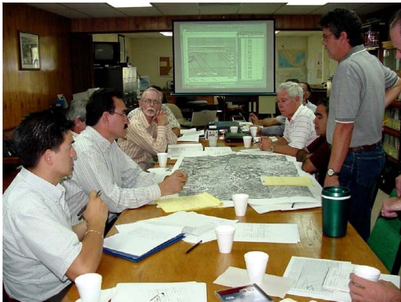
Personal de la CILA en el taller de simulación de una avenida

incluye también las presas derivadoras Anzaldúas y Retamal así como los cauces en ambos países.